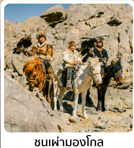
ชนเผ่ามองโกล