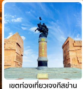
เขตท่องเที่ยวเจงกีสข่าน