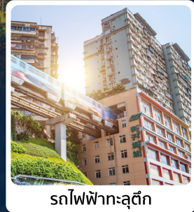
รถไฟฟ้ายุติง