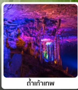
ถ้ำเก้าเทพ