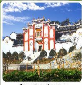
บ้านเกิดชวีหยวน