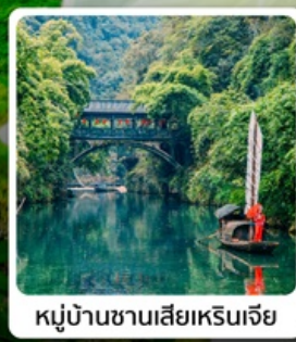
หมู่บ้านซานเสี่ยเหรินเจีย