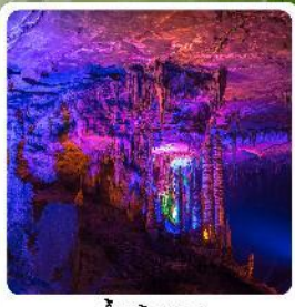
ถ้ำเก้าทง