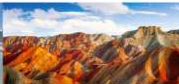
หุบเขาสายรุ้งจางเย่