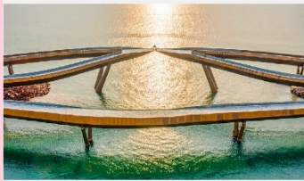
สะพานจูป