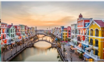
แกรนด์เวิลด์ฟู้ท๊วก