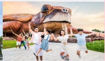
วินเพิร์ล อควาเรียม

*ทางบริษัทฯ ขอสงวนสิทธิ์ในการสลับโปรแกรมทัวร์ตามความเหมาะสมขึ้นอยู่กับสถานการณ์หน้างาน โดยคำนึงถึงผลประโยชน์ของลูกค้าเป็นสำคัญ