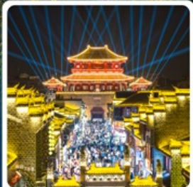
เมืองโบราณเซียงหยาง