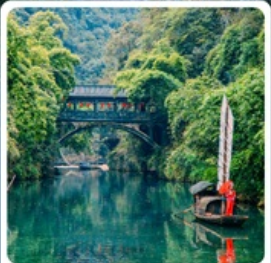
หมู่บ้านซานเสี่ยเหรินเจีย