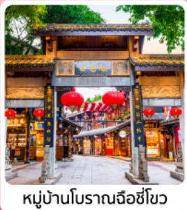
หมู่บ้านโบราณฉือซีโฮว