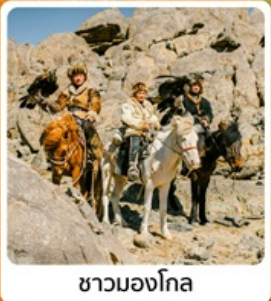
ชาวมองโกล