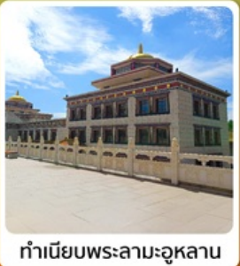
ทำเนียบพระลามะฮุหลาน