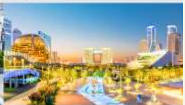
จุดชมวิว City Balcony

*ทางบริษัทฯ ขอสงวนสิทธิ์ในการสลับโปรแกรมทัวร์ตามความเหมาะสมขึ้นอยู่กับสถานการณ์หน้างาน โดยคำนึงถึงผลประโยชน์ของลูกค้าเป็นสำคัญ