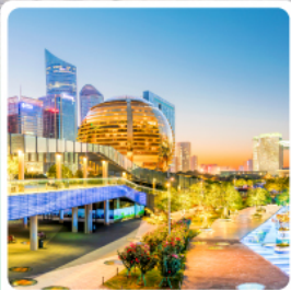
จุดชมชมวิว Balcony