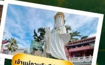
เจ้าแม่กวนอิมริฟัสเบย์