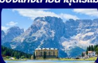
อุทยานฯ โดโลไมท์