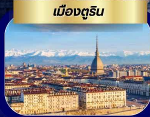
เมืองตูริน

เที่ยว 3 ประเทศ ฝรั่งเศส สวิตเซอร์แลนด์ อิตาลี เส้นทางยุโรปยอดนิยม ปารีส หอไอเฟล ประตูชัย พิพิธภัณฑ์ลูฟร์ ล่องเรือบาโตมูช ชมวิวปารีสบนสายน้ำ เจนีวา นาฬิกาดอกไม้ น้ำพุเจดโด้ เมืองโลซานน์ ศาลาไทยแห่งเมืองโลซานน์ เมืองเซอร์แมท หมู่บ้านโรัดยนต์ ชมวิวยอดเขาแมทเธอร์ฮอร์น เมืองซียง เมืองตูริน มหาวิหารตูริน เมืองมิลาน ดูโอโมแห่งเมืองมิลาน ช้อปปิ้ง SERRAVALLE OUTLET