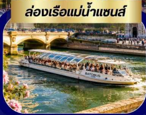
ล่องเรือแม่น้ำแซนส์