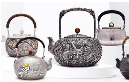
พิพิธภัณฑ์เครื่องมือเงินมองโกล