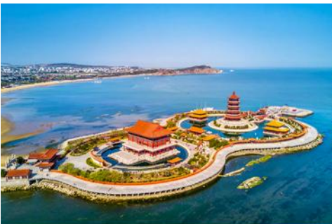
อุทยานท่องเที่ยวแปดเซียนข้ามทะเล