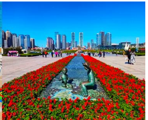
จัตุรัสชิงไห่

หลังอาหารนำท่านเที่ยวชม จัตุรัสชิงไห่ 星海广场 เป็นจัตุรัสขนาดใหญ่เป็นแลนด์มาร์คสำคัญของเมืองต้าเหลียน สร้างขึ้นเพื่อเฉลิมฉลองในโอกาสที่รัฐบาลอังกฤษคืนเกาะฮ่องกงในปี ค.ศ. 1997 ตั้งอยู่ชายฝั่งทะเลในเมืองต้าเหลียน เป็นจัตุรัสใจกลางเมืองที่ใหญ่ที่สุดในโลกและเป็นแลนด์มาร์คของเมืองต้าเหลียน รายล้อมด้วยตึกกระจาที่ทันสมัย ภายในมีบ่อน้ำพุดนตรี ลานหญ้าขนาดใหญ่ และลานกว้างสำหรับจัดกิจกรรมกลางแจ้ง อาทิ เทศกาลเบียร์นานาชาติ การแข่งขันวิ่งมาราธอน งานแฟชั่นนานาชาติเมืองต้าเหลียน ฯลฯ