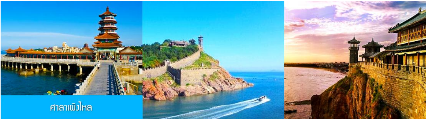
ศาลาฝั่งไหหล

หลังอาหารนำท่านเดินทางสู่เมืองฝั่งไหหล ชม ศาลาฝั่งไหหล ดินแดนแห่งเทพเซียน และเป็นหนึ่งในสี่สถาปัตยกรรมโบราณที่งดงามของจีน ซึ่งตั้งอยู่ริมทะเล ( ชมด้านนอก )