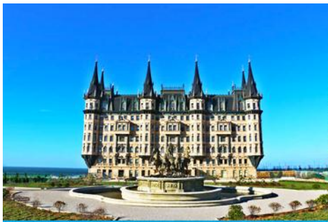
คฤหาสน์เหวินเจิง

นำท่านไปเยือนเมืองท่าสุดโรแมนติคสไตล์ยุโรป ท่าเรือชาวประมง ให้ท่านได้ชมสถาปัตยกรรมสไตล์อเมริกาเหนือ และ ยุโรป ที่ตั้งอยู่ในพื้นที่ผืนดินจีน ณ เมืองเยียนไถ เก็บบรรยากาศลมทะเล และเก็บรูปกับอาคารหลังคาสี่เหลี่ยมเป็นฉากหลัง ที่เต็มไปด้วยมนต์เสน่ห์และความทรงจำที่สวยงาม ให้ท่านเก็บภาพความสวย