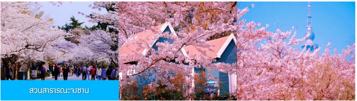
สวนสาธารณะจางซาน

ถึงชิงเต่า นำท่านชมสวนสาธารณะจางซาน สวนจางซานได้ขึ้นชื่อว่าเป็นสวนที่ชมซากุระสวยที่สุดในเมืองชิงเต่า พอถึงช่วงดอกบาน ต้นซากุระสองข้างทางจะผลิบานพร้อมกัน กลายเป็นอุโมงค์สีชมพูขาว เดินเข้าไปในสวน แล้วบรรยากาศคือหวานละมุน และดูโรแมนติก จะบานช่วงปลายมีนา ถึง ต้นพฤษภาคม