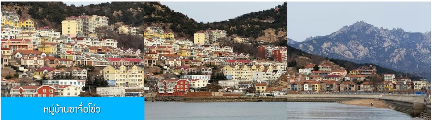
หมู่บ้านซาจื่อโข่ว

เที่ยง รับประทานอาหารกลางวัน ณ ภัตตาคาร (มื้อที่ 7)