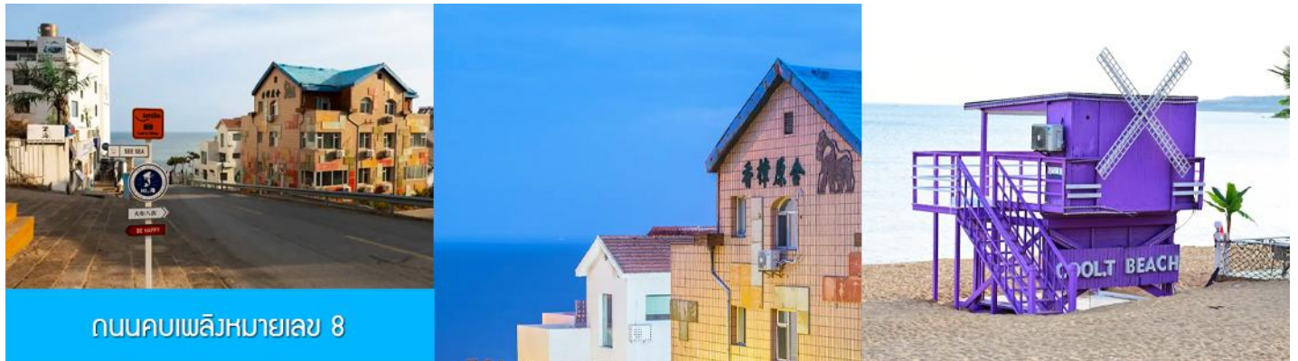
ถนนคบเพลิงหมายเลข 8

นำท่านจิบไวน์ในปราสาทสไตล์ยุโรป หลีกหนีความวุ่นวายและก้าวเข้าสู่ดินแดนที่ราวกับหลุดมาจากเทพนิยายยุโรป ณ ไรไวน์ ชาโตว์ ณ คตฺหาสน์ จางยู ปราสาทไวน์อันโอ่อ่าที่ตั้งตระหง่านกลางไร่องุ่นสุดลูกหูลูกตาในเมืองเยียนไถ มณฑลซานตง ที่นี่คือการบรรจบกันอย่างลงตัวของมรดกการผลิตไวน์กว่าร้อยปีของจีนและความเชี่ยวชาญจากฝรั่งเศส ทำให้เกิดเป็นแหล่งท่องเที่ยวที่ไม่เพียงสวยงามน่าถ่ายรูป แต่ยังเป็นสวรรค์ของคนรักไวน์ นำท่านเดินชมสถาปัตยกรรมคลาสสิก เยี่ยมชมห้องเก็บไวน์ใต้ดินอันลึกลับ และปิดท้ายด้วยการชิมไวน์รสเลิศที่ผลิตจากองุ่นในไร่แห่งนี้ เสริมแต่งประสบการณ์ที่จะทำให้การเดินทางของคุณพิเศษยิ่งขึ้น ปิดท้ายประสบการณ์อันสุดแสนคลาสสิกนี้... ด้วยการ ลิ้มรสไวน์แดง (ท่านละ 1 แก้ว) ที่มีชื่อเสียงของที่นี่, จากนั้น นำท่านเดินทางสู่ เมืองเว่ยไห่ 威海 ตั้งอยู่ปลายสุดของคาบสมุทรซานตง ซึ่งเป็นเมืองท่าสำคัญที่มีชายฝั่งทะเลสวยงามสะอาด อากาศเย็นสบายในฤดูร้อนและมีหิมะตกหนักในฤดูหนาว ได้รับอิทธิพลวัฒนธรรมเกาหลีได้เนื่องจากที่ตั้งใกล้ที่สุด จุดเด่นคือเกาะหลิวกง เมืองหัวเซี่ยเฉิง และบรรยากาศเมืองท่าที่พักผ่อนสบาย นำท่านเก็บบรรยากาศกับ กรอบรูปวิวทะเล อีกหนึ่งไฮไลท์สุดฮิตที่มาเว่ยไห่ ต้องถ่ายรูปกับจุดนี้