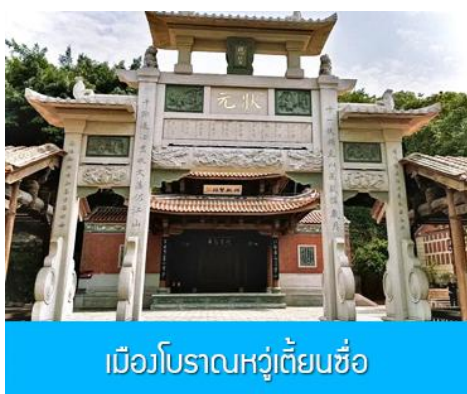
เมืองโบราณหวู่เตี้ยนซือ

พักที่ โรงแรม XIAMEN HENGLONG HOTEL 4* หรือเทียบเท่าในเมืองเซี่ยเหมิน