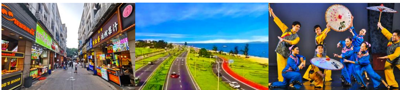
ถนนวซาลู่

พักที่ โรงแรม XIAMEN HENGLONG HOTEL 4* หรือเทียบเท่าในเมืองเซี่ยเหมิน