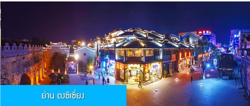
ย่าน ตะขีซี้ย