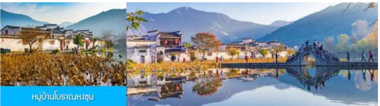
หมู่บ้านโบราณหงซุน

พักที่ โรงแรม QISHUHU HOTEL OR ZHONGCHENG SHANZHUANG 4* หรือเทียบเท่าในเขตอุทยานหวงซาน