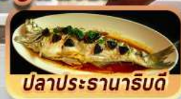
ปลาประรานาภิรมดี