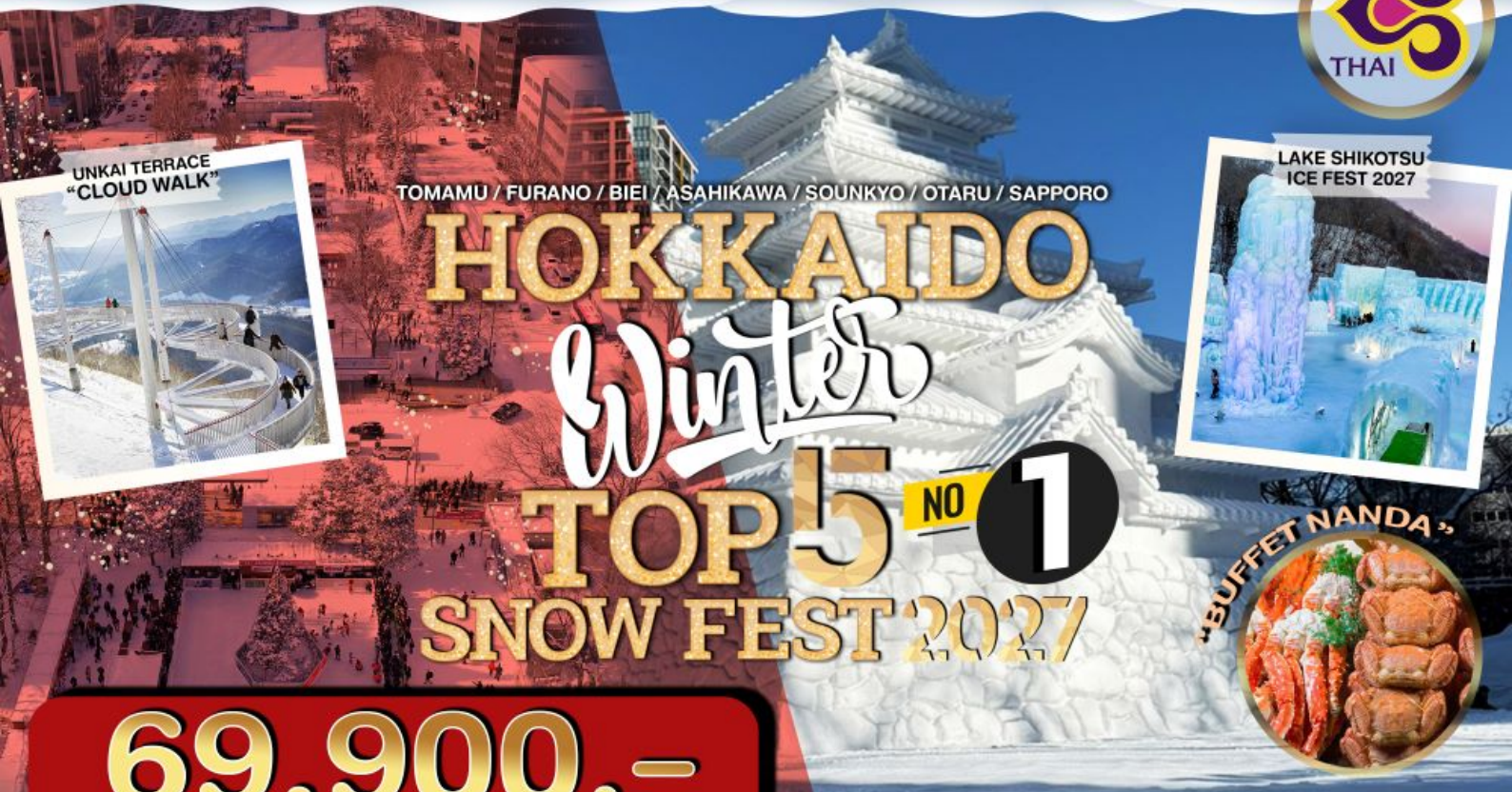
UNKAI TERRACE "CLOUD WALK"

TOMAMU / FURANO / BIEI / ASAHIKAWA / SOUNKYO / OTARU / SAPPORO