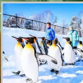
“PENGUIN ASAHIYAMA ZOO”