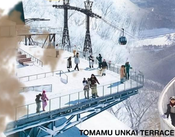
TOMAMU UNKAI TERRACE