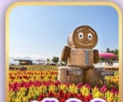
สวนซิกิไซโนะโอกะ

เดินทาง 34 ท่าน น้ำหนักกระเป๋า 20 KG อาหาร 5 มื้อ