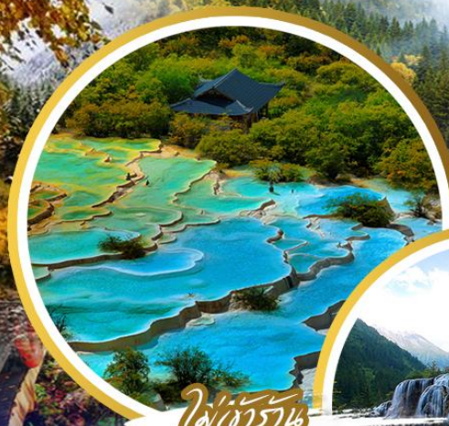
ไฟ้อร้อน