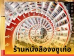
ร้านหนังสือจุกเก๋