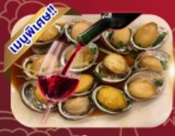
ซีฟู้ด เป้าอ้อะไอน์แดง