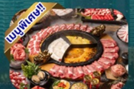
ซูฟไฟ้ชญา

พักโรงแรม 4 ดาว ★★★★★ ฟรี ประกันอุบัติเหตุ บริการอาหารท้องถิ่น