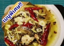
ปลาต้มผักกาดดอง