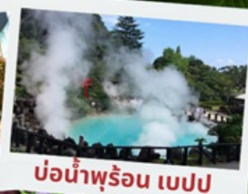
บ่อน้ำพุร้อน เบปปุ

หมู่บ้านยูฟูอินฟลอร์ริล ทะเลสาบคินริน ทะเลสาปคินริน บ่อน้ำพุร้อน อุมิจิโกกุ ท่าเรือโมจิโกะ เรโทร ตลาดปลาคาราโตะ ศาลเจ้ามียาจิดาเกะ ดิวตี้ฟรี ฟุกุโอกะ เบย์ พลาซ่า ช้อปปิ้งออน มอลล์ หินคู่เมโอะโตะอิวะ ชมดอกไม้ไฮเดรนเยีย รอนน้ำตกชิราอิโตะ ช้อปปิ้งย่านเท็นจิน