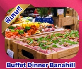
Buffet Dinner Banahill