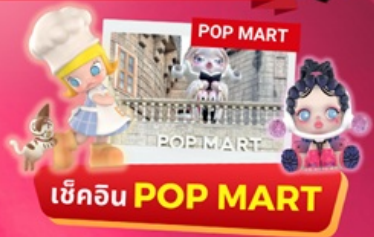
เช็किन POP MART