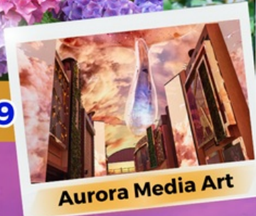
Aurora Media Art