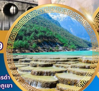
ทะเลสาบไป๋สยเหอ

เมืองโบราณคู่เสียง เมืองโบราณต้าหลี่ เจดีย์สามองค์ เมืองโบราณแชงกรี่ล่า วัดชงจันหลิน ช่องแคบเสือกะโจน สระมิงกรต้า เมืองโบราณลี่เจียง ภูเขาหิมะมังกรหยก ชมวิวภูเขา หิมะที่ร้าน Yun di an ทะเลสาบเทียนจื่อ เมืองโบราณกวนตุ๋ วัดหยวนทง