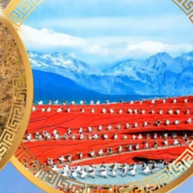
ความประทับใจแห่งลี่เจียง