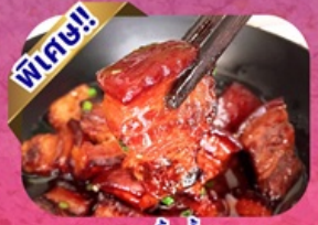
หมูสามชั้นน้ำแดง

พักโรงแรม 4 ดาว 5★ ฟรี ประกันอุบัติเหตุ บริการอาหารท้องถิ่น