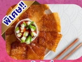
เป็ดปักกิ่ง