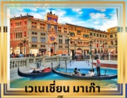
เวเนเซียน มาเก๊า