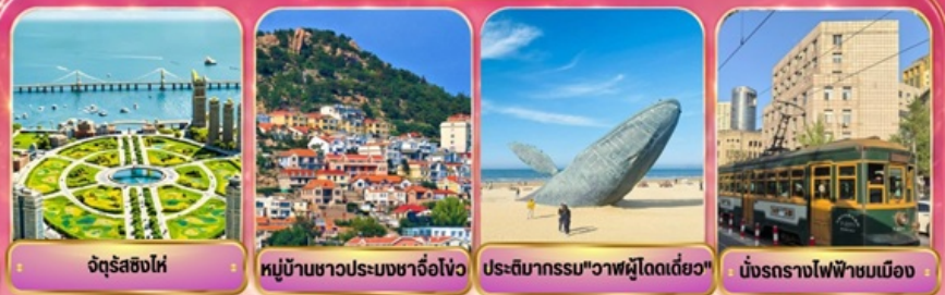
จัตุรัสชิงไห่ หมู่บ้านชาวประมงซาโจ่วโถว ประติมากรรม "วาฬผู้โดดเดี่ยว" บั๊กรถรางไฟฟ้าชมเมือง