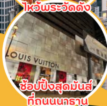
ช้อปปิ้งสุดมันส์ ที่ถนนนทราณ