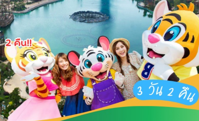
3 วัน 2 คืน