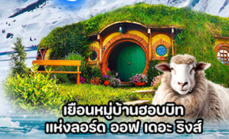
เยือนหมู่บ้านฮอบบิท แห่งลอร์ด ออฟ เดอะ ริงส์