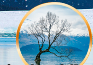
ถ่ายรูปต้นวานากาผู้โดดเดี่ยว ที่ทะเลสาบวานากา