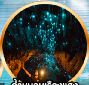
ดำหนอนเรืองแสง ไวท์โทบี

10 D | 22-31 ก.ค. 69 (วันเฉลิมฯ, อาสาพหุชา, เข้าพรรษา) 8 N | 08-17 ส.ค. 69 (วันแม่แห่งชาติ)