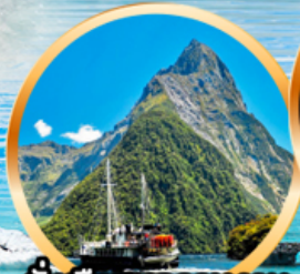
นั่งเรือชมความงาม ฟยอร์ดแห่ง มิลฟอร์ด ซาวด์