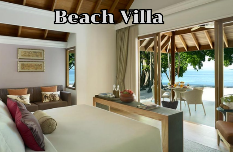
Deluxe Beach Villa with Pool