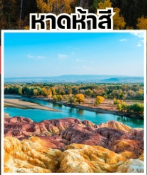
หาดห้าสี