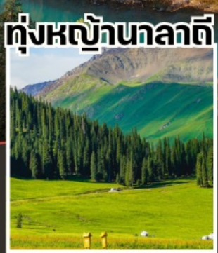
ทุ่งหญ้านาลาตี

วันเดินทาง 28 พค - 5 มิย 18 - 26 มิย 16 - 24 กย 22 -30 กย