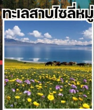
ทะเลสาบไซลีหมู่