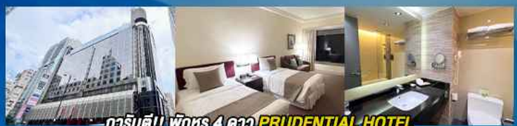
гаринดี!! พักหรู 4 ดาว PRUDENTIAL HOTEL ติดถนนนาธาน ย่านช้อปปิ้งจิมซาจุ่ย