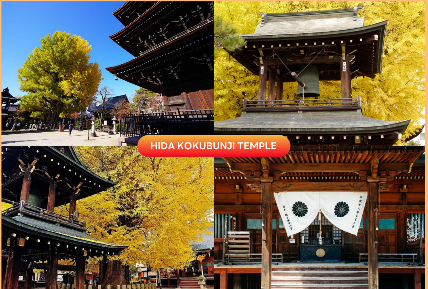
HIDA KOKUBUNJI TEMPLE

นำท่านสู่ เมืองทาคายาม่า (Takayama) เป็นเมืองเล็ก ๆ ตั้งอยู่ใน จ.กิฟุ ที่โอบล้อมไปด้วยภูเขา และธารน้ำใสจำนวนมาก เพื่อนำท่านชม วัดฮิดะโคคุบุบงิจิ (Hida Kokubunji Temple) เป็นวัดพุทธที่เป็นเหมือนสัญลักษณ์ของเมืองทาคายาม่า เจดีย์สามชั้นองค์นี้สร้างขึ้นในปี 1820 ภายในอุโบสถมีพระพุทธรูปที่สร้างขึ้นในยุคเฮอันให้สักการะ ภายในบริเวณวัดมีต้นแปะก๊วยขนาดใหญ่ที่ว่ากันว่ามียุคถึง 1,250 ปี ที่ใครมาทาคายาม่าก็ต้องไปชมเลยทีเดีย (ราคาทัวร์รวมค่าเช้า) (การเปลี่ยนสีของใบไม้ ขึ้นอยู่กับสภาพอากาศเป็นสำคัญ)