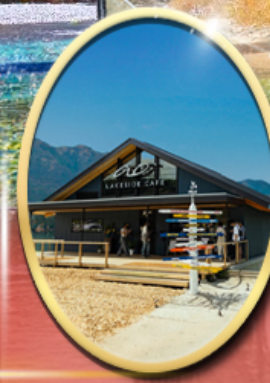
Ao Lakeside Cafe

34,919 ราคาเริ่มต้น บาท รวมภาษีมูลค่าเพิ่ม 7%