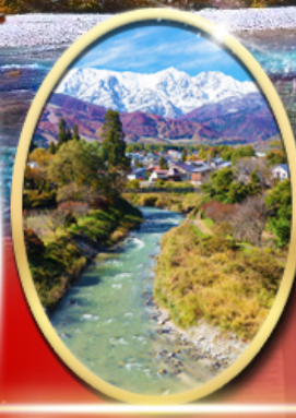
ไอโอดีพาร์ค