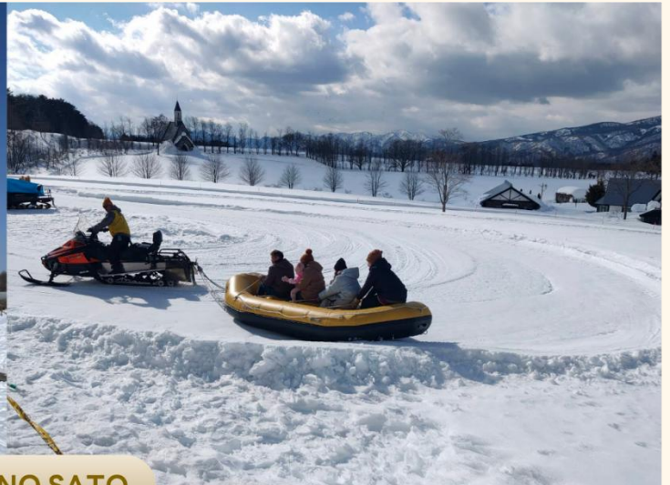
BOKKA NO SATO