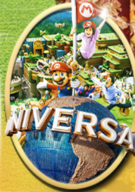
อิสระเลือกซื้อบัตร Universal Studios Japan