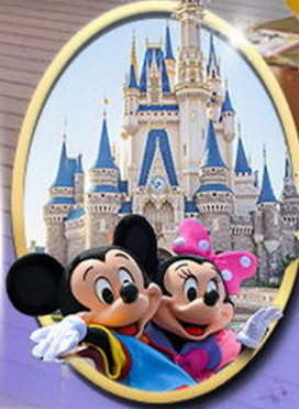
อิสระเลือกซื้อบัตร Tokyo Disneyland