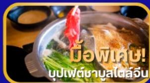
มือพิเศษ! บุปเฟ่ต์ชาบูสไตล์จีน