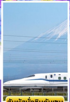
สัมพัสนั่งชินคันเซน