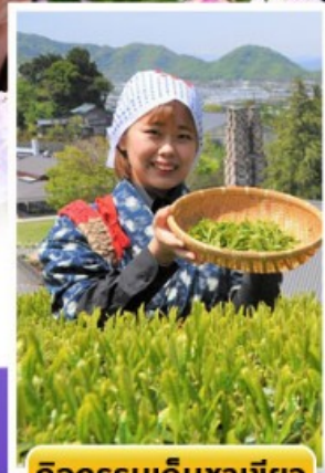
กิจกรรมเก็บชาเขียว