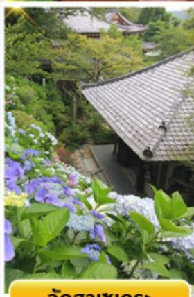
วัดฮาเซเดระ