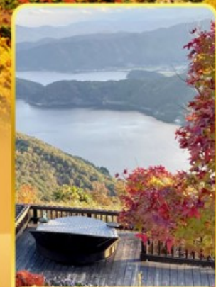
จุดชมวิวกะเลสาบมิกาดะ