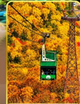
กระเช้าคุโรดากะ

ออนเซ็น 3 คั้น นน.กระเป๋า 23 กก. 7Days 5Night