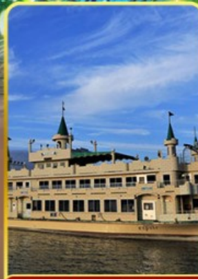
ล่องเรือทะเลสาบโทยะ