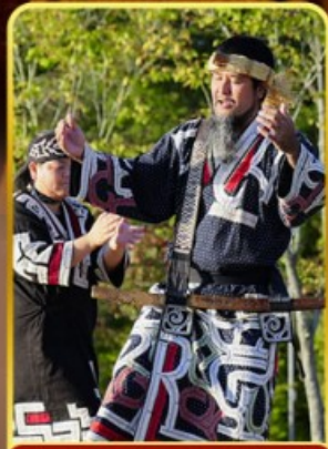
พิธีภักดิ์อินู