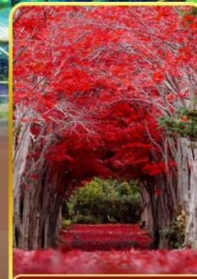
สวนอิระโอกะ