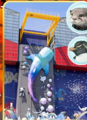
พิพิธภัณฑ์โรคคัส