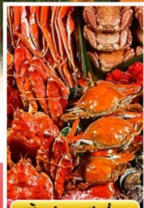
ปิ้งย่างพรีเมียม