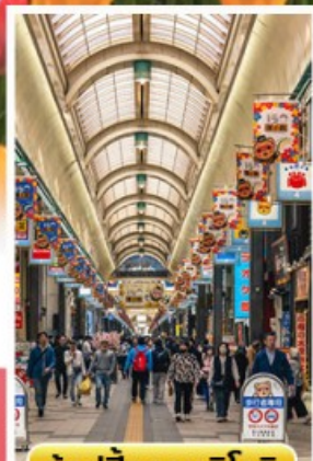
ช้อปปิ้งทานุกิโคจิ